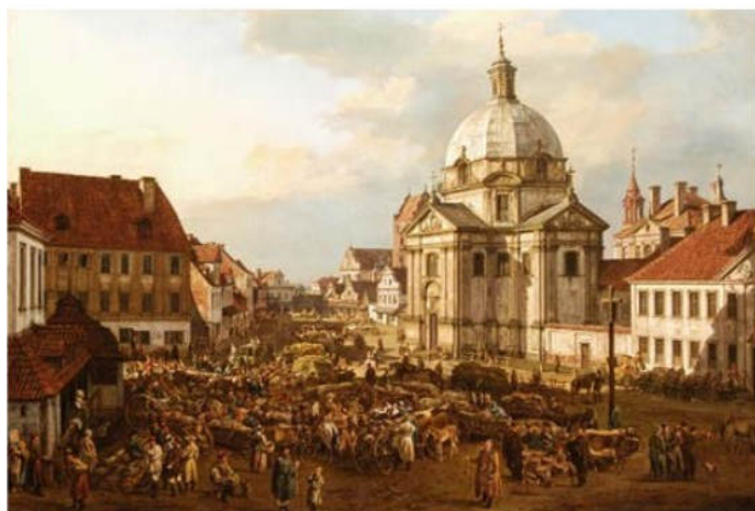
Kościół Sakramentek to obraz Canaletta z 1778 roku. Dzieło malarza ułatwiło odbudowę kościoła po zniszczeniach z czasów II wojny światowej.

Canaletto był nadwornym malarzem Stanisława Augusta Poniatowskiego. Artysta podczas swego pobytu w Polsce stworzył wiele obrazów XVIII-wiecznej Warszawy i pałacu w Wilanowie. Prace zachwycają dbałością o szczegóły. Dzięki obrazom Canaletta możemy zobaczyć, jak wyglądały Warszawa i życie jej mieszkańców w czasach Stanisława Augusta.