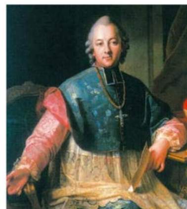
Biskup Ignacy Krasicki (*1735 †1801) to jeden z najwybitniejszych polskich poetów. Oprócz bajek i fraszek napisał także pierwszą polską powieść – Mikołaja Doświadczyńskiego przypadki .

Najwybitniejszymi twórcami dramatów w Polsce byli Julian Ursyn Niemcewicz i Wojciech Bogusławski . Pierwszy z nich napisał słynny dramat Powrót posła , w którym nawoływał do gruntownych reform państwa oraz piętnował zacofanie i lenistwo części szlachty. Wojciech Bogusławski – zwany „ojcem polskiego teatru narodowego” – jest autorem sztuki zatytułowanej Cud mniemany, czyli Krakowiacy i górale . Jej bohaterami są postacie z polskiego ludu, których wypowiedzi odnoszą się do aktualnej sytuacji w kraju i wzywają rodaków do walki z zaborcami.