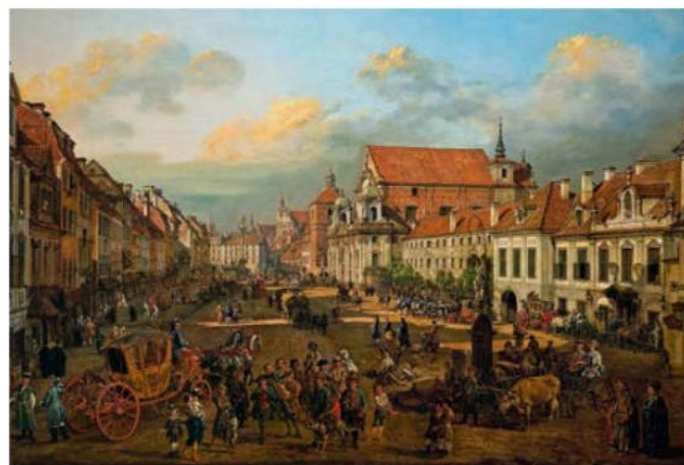
Krakowskie Przedmieście w stronę placu Zamkowego , dzieło z 1774 roku, ukazuje główną ulicę Warszawy. Oprócz szczegółów architektonicznych malarz przedstawił też codzienne zajęcia mieszkańców.

? Dlaczego obrazy Canaletta są cennym źródłem wiedzy historycznej?