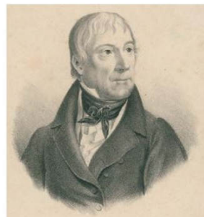
Wojciech Bogusławski (*1757 †1829) był aktorem i autorem sztuk teatralnych. Przez 30 lat pełnił też funkcję dyrektora Teatru Narodowego.